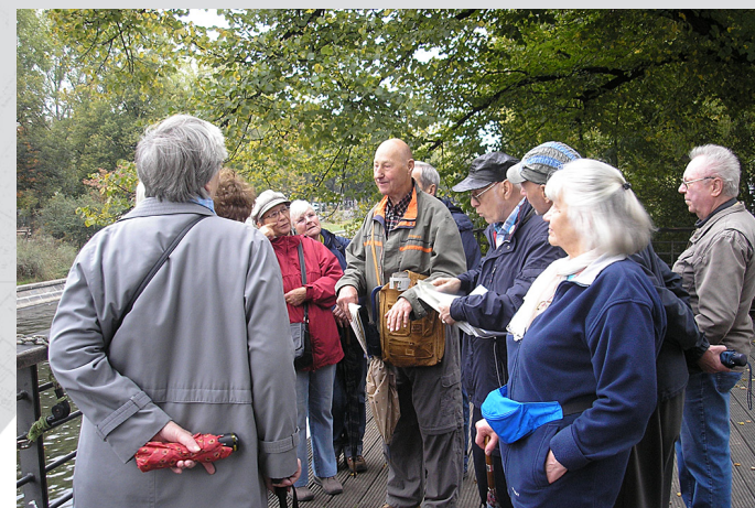
Spaziergang entlang des Maybachufers mit Informationen zur Geschichte, 30.09.2014

Ansprechpartnerinnen und Kontakte siehe Rückseite